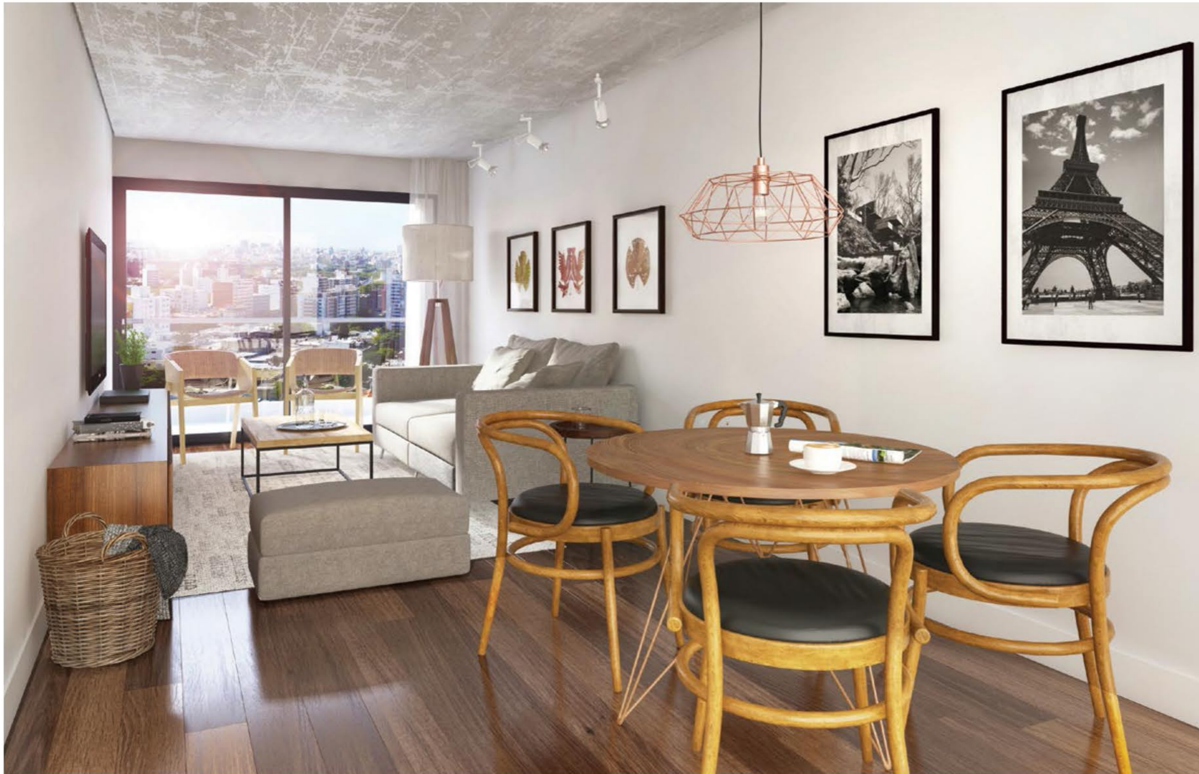
Vista desde interior de apartamento de 1 dormitorio